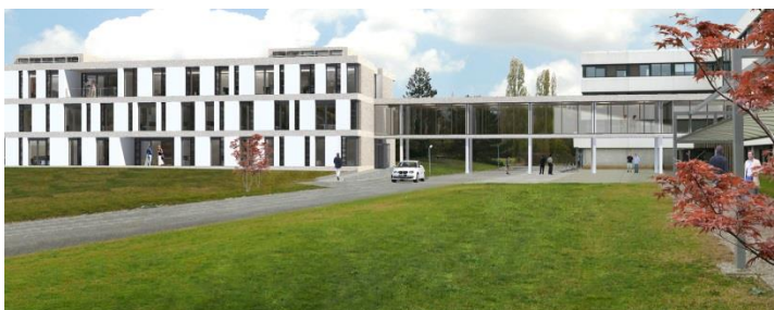
Représentation du bâtiment du « Star-Up Accelerator » à Lyon D'autres photos en haute-résolution sont disponibles sur demande

Le « Start-Up Accelerator » sera ouvert à des entrepreneurs du monde entier et ne leur apportera pas uniquement l'accès à des bureaux, laboratoires et centres de test au sein du premier Centre de R&D du secteur. Ils bénéficieront également du réseau d'experts techniques du Groupe et de leur expérience commerciale et marché à travers le monde. Dans le cadre de ce projet, LafargeHolcim a l'intention de nouer des partenariats avec d'autres entreprises afin que les innovations remontent la chaîne de valeur. Les premières jeunes entreprises sont attendues à partir de mi-2017.