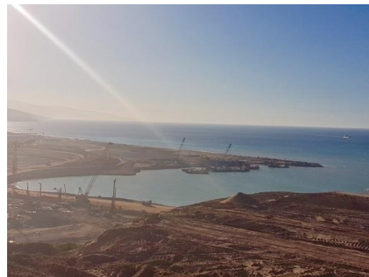
Chantier de Nador West Med, au Maroc Entrepreneur : STFA (Turquie), SGTM (Maroc) et Jan de Nul (Belgique)