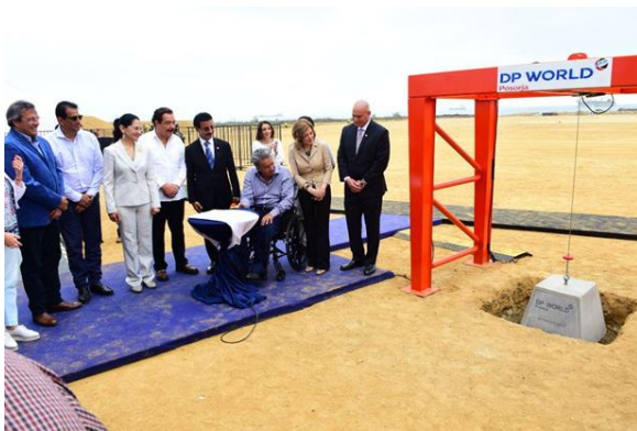
Cérémonie de lancement de la construction du port de Posorja, en Equateur Entrepreneur : CHEC

LafargeHolcim a participé à plus de 30 projets portuaires dans 20 pays, fournissant des solutions ciment et béton adaptées pour le nouveau terminal du port de Rijeka, en Croatie, ou des bétons uniques à prise rapide pour le port de Kuantan, en Malaisie. En Allemagne, LafargeHolcim a fourni du ciment respectueux de l'environnement pour la construction du JadeWeserPort à Wilhelmshaven, le seul port en eaux profondes du pays. En Australie, LafargeHolcim a participé à la construction de l'installation de gaz naturel liquéfié de Gorgon en fournissant des formules de béton très techniques et un certain nombre de services, dont un laboratoire et des centrales à béton sur site.